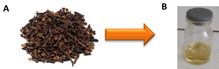
Figura 1- Botões florais de S. aromaticum (A), OECRAVO (B)

O OE dos botões florais de Syzygium aromaticum foi obtido por hidrodestilação em aparelho do tipo Clevenger durante 2h. Em seguida, o óleo essencial foi coletado, armazenado em frascos de vidro (Fig. 1) e estocados em freezer.