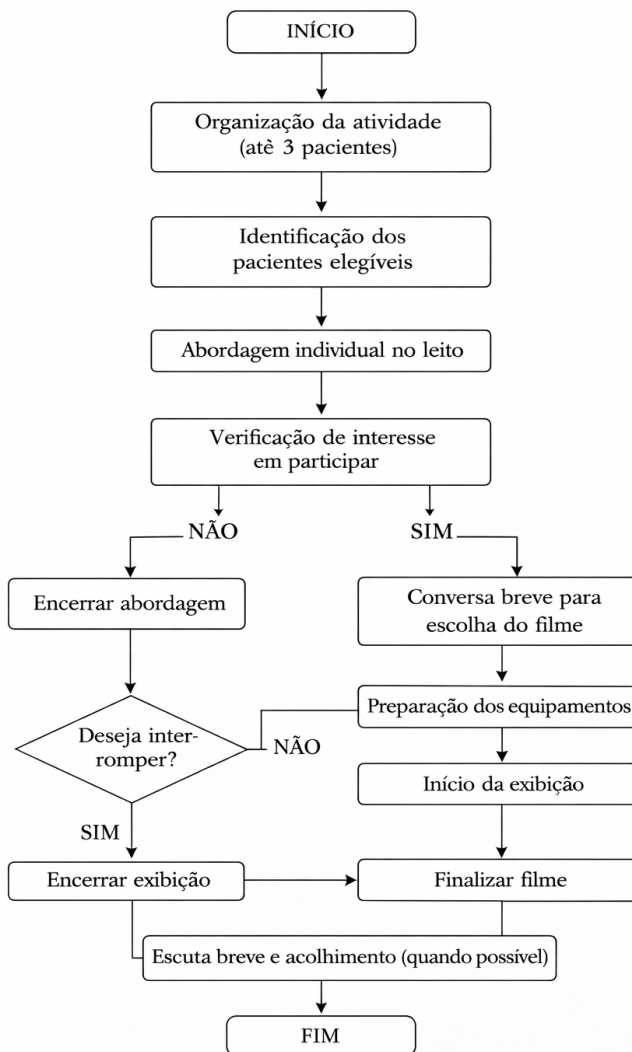
Figura 3 - Fluxograma da aplicação do projeto