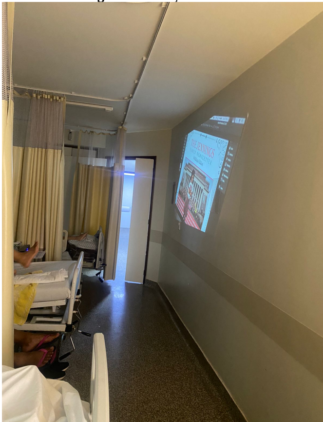
Figura 1 - Exibição do filme

o momento do tratamento e o quadro clínico (pacientes internados em enfermarias tendem a apresentar quadros clínicos fragilizados e podem apresentar sintomas como fadiga extrema, náuseas, gastroenterites, vômitos, constipação, mucosite, dor de difícil controle entre outros). Há uma característica comum nas enfermarias dos hospitais públicos, elas são compostas por mais de um leito, então a escolha do filme nem sempre conversa com a necessidade de todos os pacientes, mas é possível ser acordada entre eles.