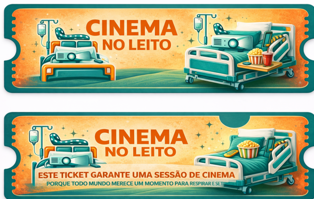
Figura 2: Elaboração própria com auxílio da ferramenta de inteligência artificial Chat GPT (2026).

A iniciativa busca transformar o ambiente hospitalar em um espaço que transmita conforto e tranquilidade, favorecendo o acesso e a compreensão dos sentimentos vivenciados nesse contexto, além de possibilitar a construção de novas estratégias de enfrentamento.