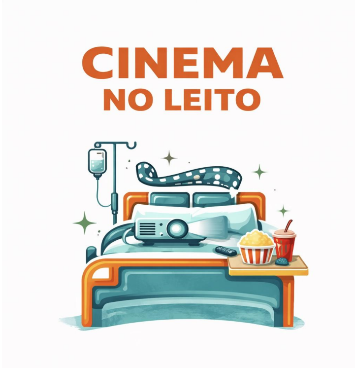
Figura 3: Elaboração própria com auxílio da ferramenta de inteligência artificial Chat GPT (2026).